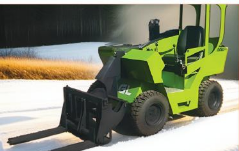
LIFTRUCK MODEL : AGL 2135