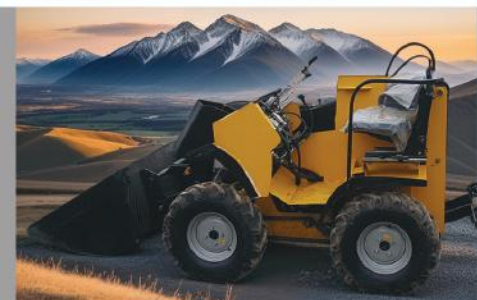
MINILOADER MODEL : AGL 3144