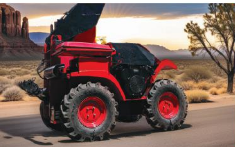
AGROLOADER MODEL : AGL 1135